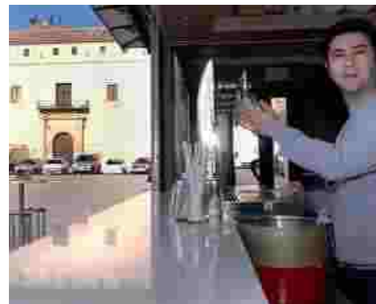
Plaza de la Hora nº 4 PASTRANA