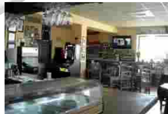
Glorieta de los Mártires n o 2. SACEDÓN