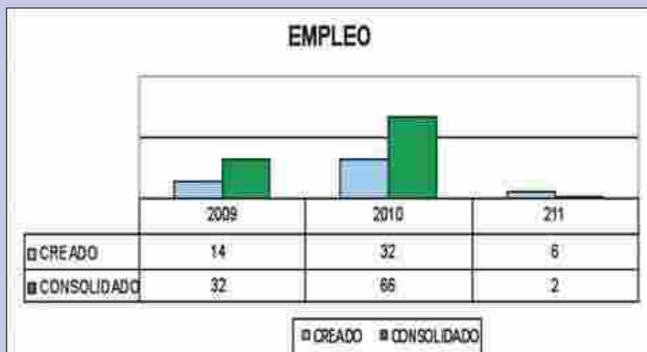
TOTAL DE EMPLEO ENTRE APROBADO Y CERTIFICADO

Si entendemos eficacia como la capacidad para producir el efecto deseado en función de un parámetro, en este caso en función de la subvención aprobada, de los cuadros reproducidos al lado se observa que durante el ejercicio 2010 es necesario 39,51 mil € para crear un empleo; mientras que en el 2009 eran necesario 80,56 mil €