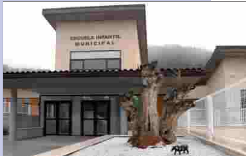
Centro de Atención a la Infancia de Chiloeches

de Proyecto de Interés Regional, con la subvención adicional establecida, la cual no podrá superar 800.000 € para actuaciones productivas y 1.300.000 € para no productivas. La subvención adicional resultará aplicable a la inversión elegible el porcentaje de subvención establecido por el Grupo de Desarrollo Rural en su Resolución Aprobatoria, previo descuento de la subvención otorgada por el Grupo.