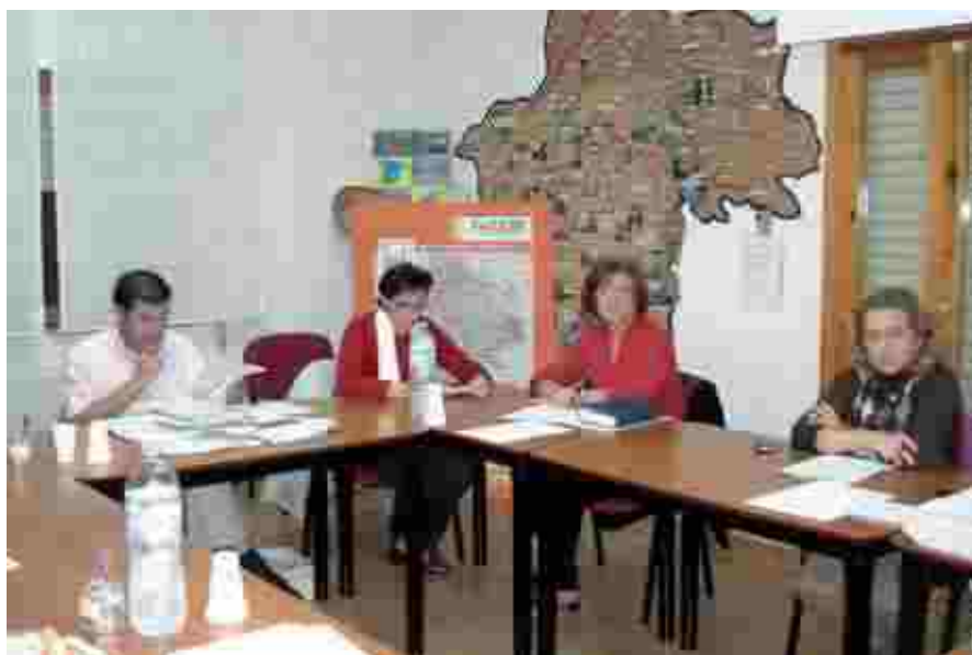
Un momento de la Junta Directiva celebrada el pasado 11 de noviembre de 2009.

A veintidós de octubre, las inversiones previstas ascienden a la nada desdeñable cantidad de 7.088.402 euros, además de otros 10 proyectos que no se subvencionarán, por no cumplir con todas las condiciones exigidas.