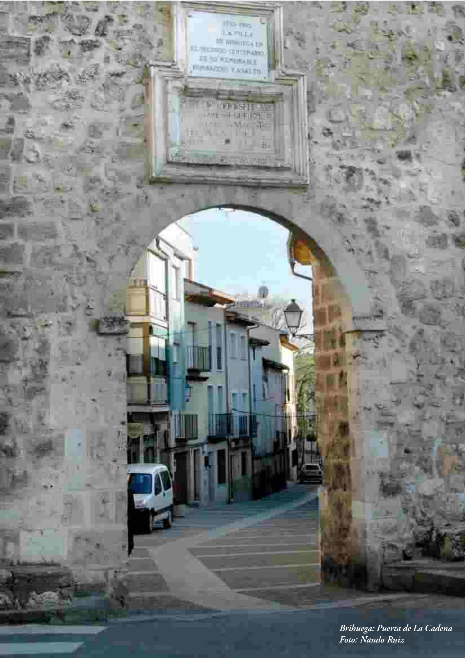
Brihuega: Puerta de La Cadena